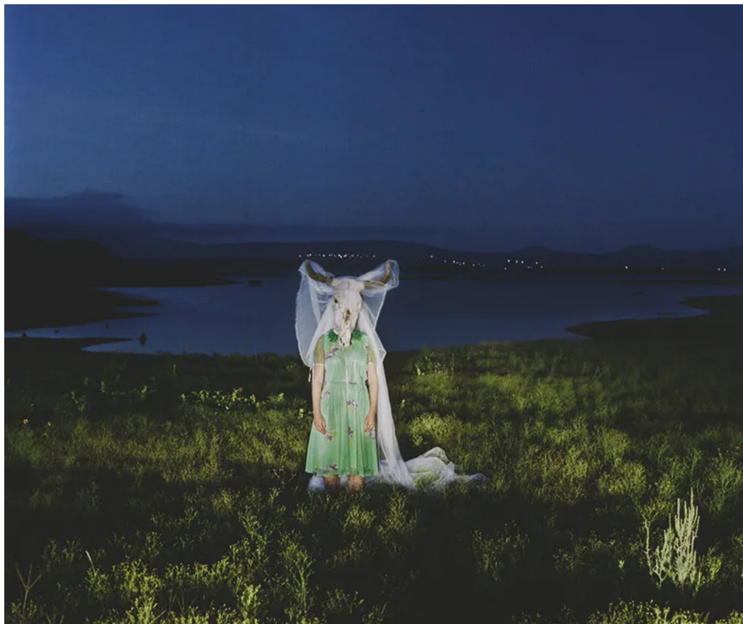
Fotografía de la serie La Llorona .