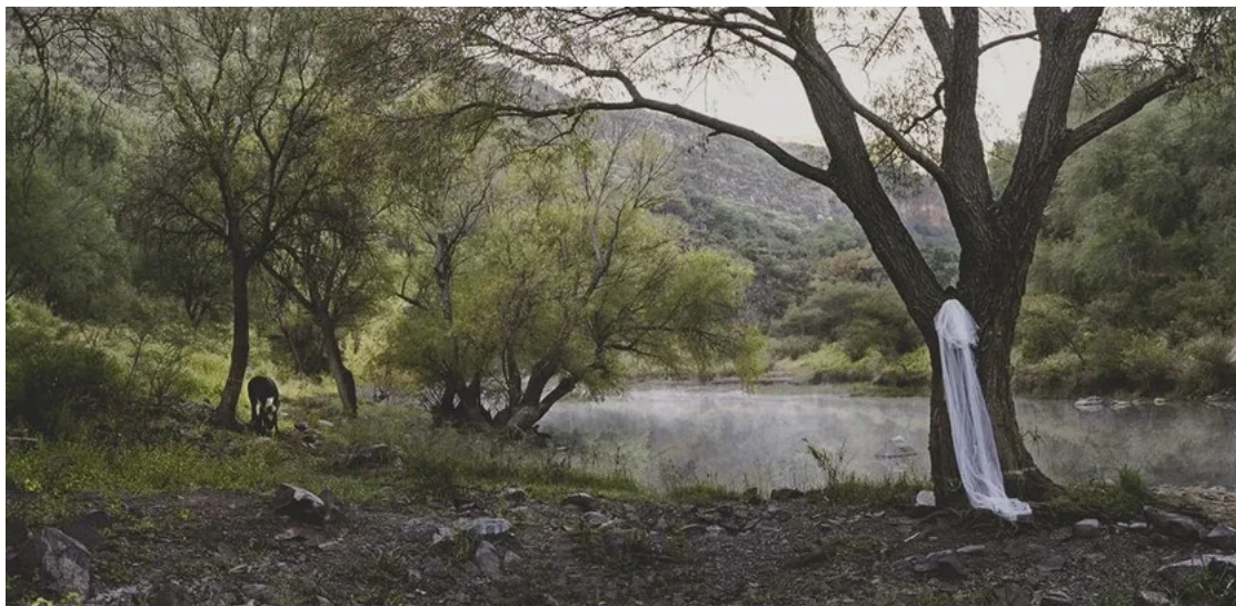
Fotografía de la serie La Llorona .