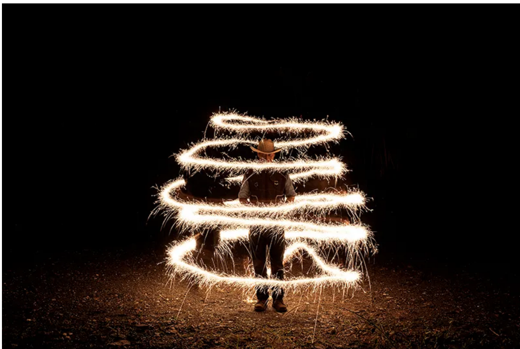
Fotografía de la serie Iluikak .