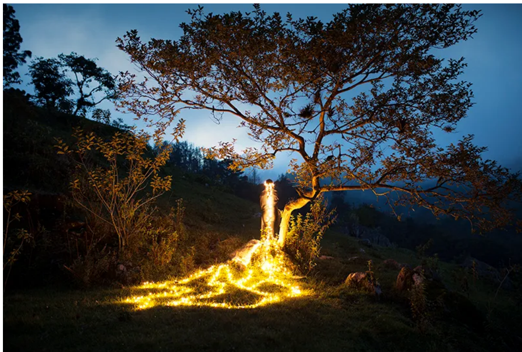
Fotografía de la serie Iluikak .