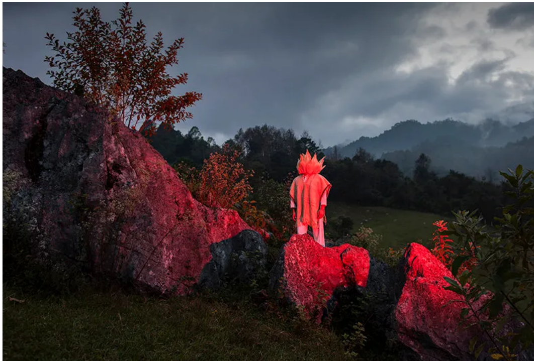
Fotografía de la serie Ilukak .