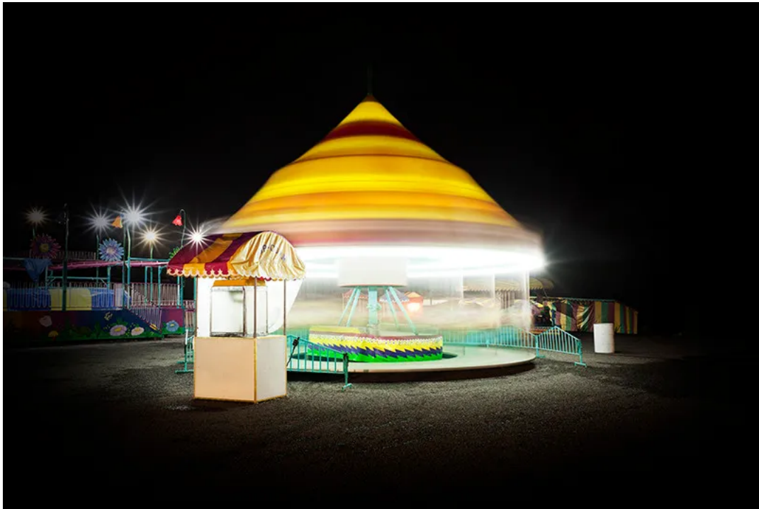
Fotografía de la serie Eutopía Lúcida .