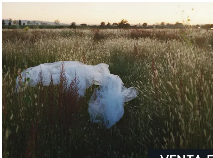
Fotografía de la serie La Llorona .