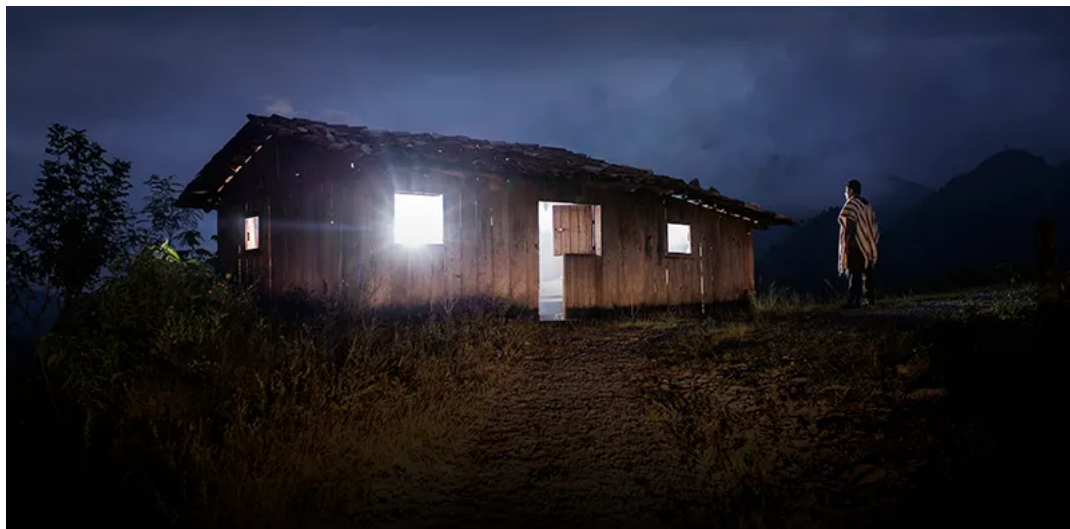
Fotografía de la serie Iluikak .