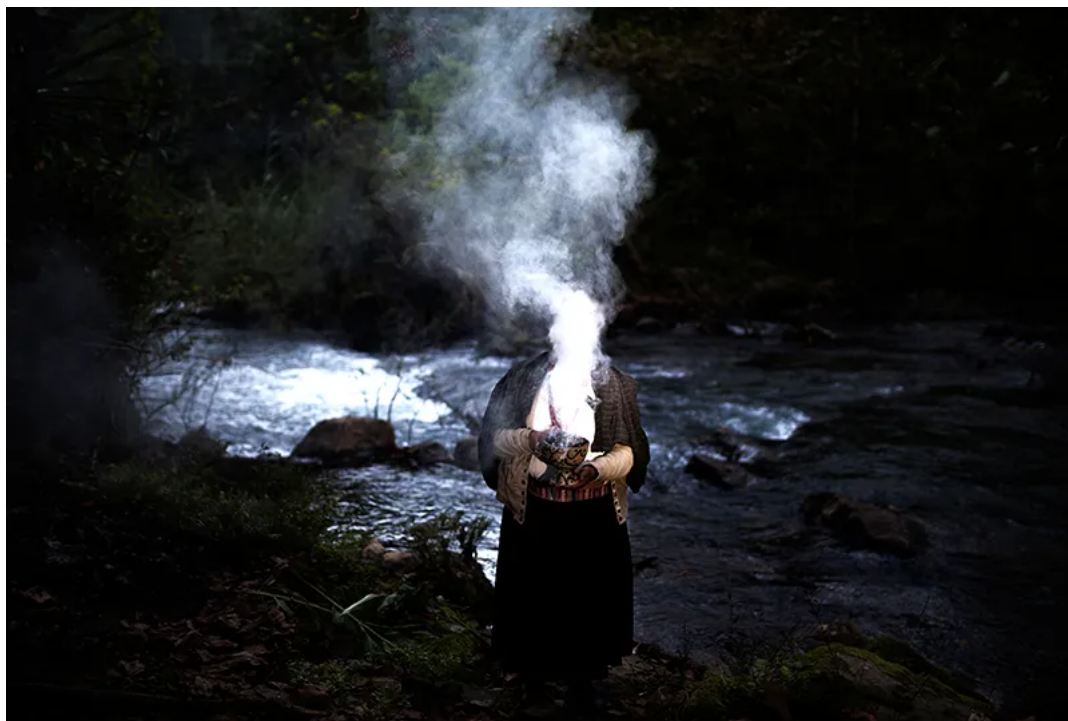
Fotografía de la serie Iluikak .