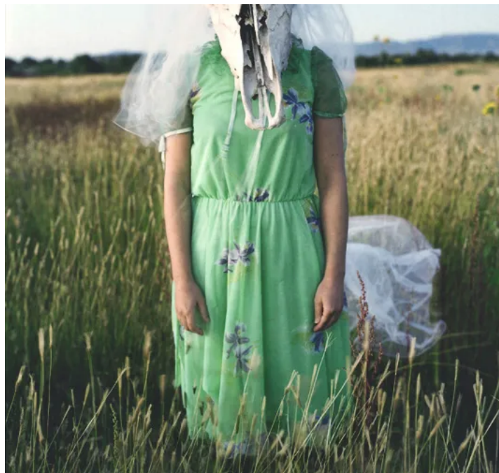
Fotografía de la serie La Llorona .