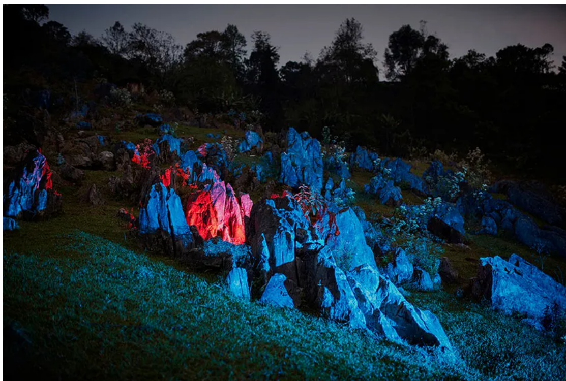
Fotografía de la serie lluikak .